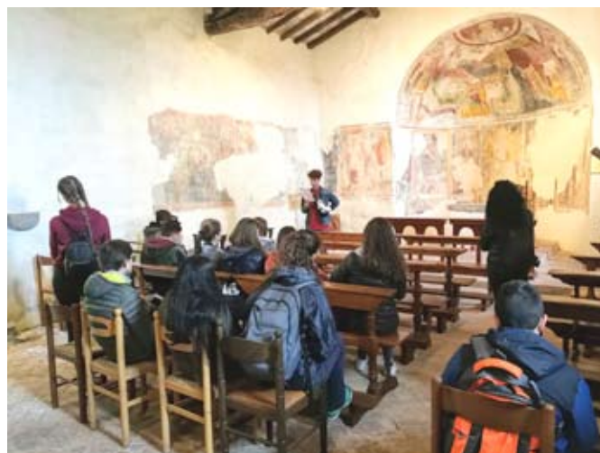
Allegria, colori e cultura