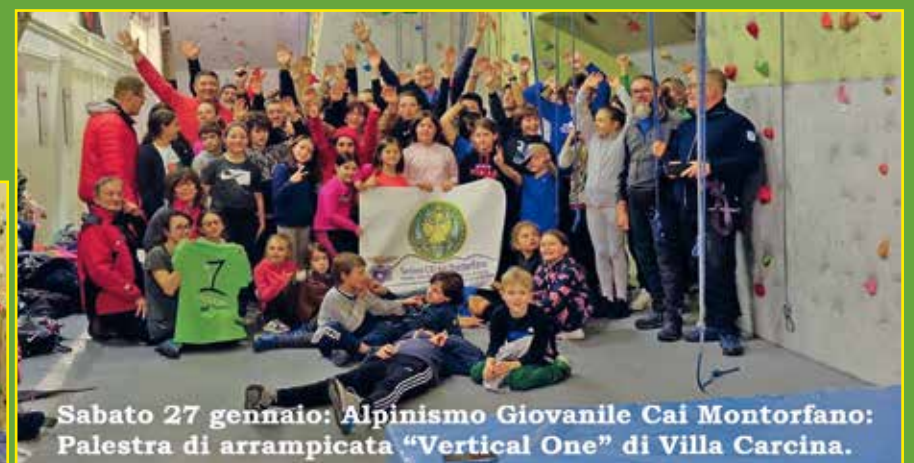
Sabato 27 gennaio: Alpinismo Giovanile Cai Montorfano: Palestra di arrampicata "Vertical One" di Villa Carcina.